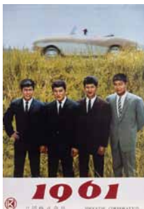
和田浩治・赤木圭一郎・小林旭・石原裕次郎 1961年日活カレンダーより