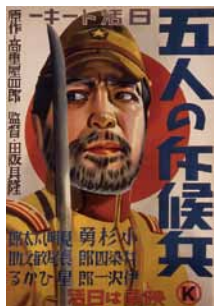
『五人の兵隊』(1938年)ポスター