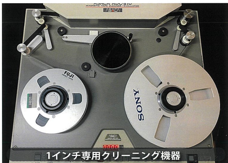
1インチ専用クリーニング機器

古いテープには見えないカビや貼りつきが発生していることが多く、そのまま再生すると、テープ切れの原因になります。大切な映像資産を守るためには、熱処理と丁寧なクリーニング処理が必須です。弊社では、各種クリーニング機器を使用し、より美しい画質でのデジタル化を実現します。