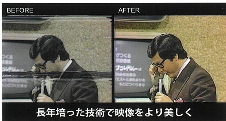
長年培った技術で映像をより美しく