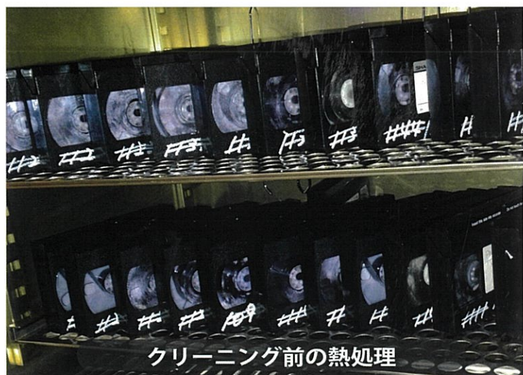
クリーニング前の熱処理