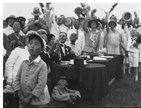
画像 6 『ツェツペリン来たる』 動画：2:59~3:21