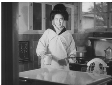
画像 5 『臺所の改善』 動画：2:24~2:56