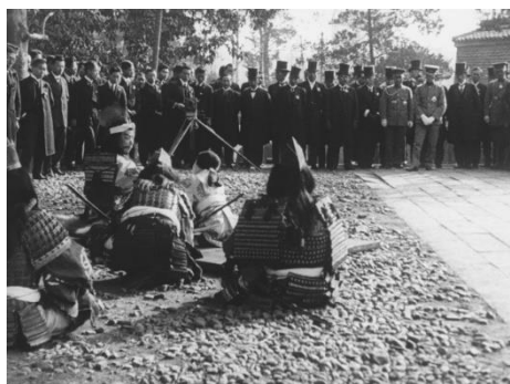
画像 1 『史劇 楠公訣別 [デジタル復元版]』 動画：0:00~0:24