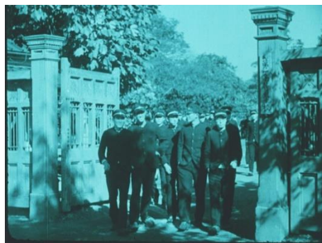
画像 4 『一高生活』 動画：1:49~2:21