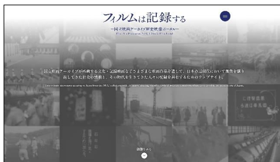
WEB サイト TOP イメージ