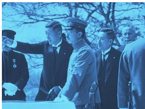
画像 3 『輝やく大東京 第一篇 光榮の御巡幸 昭和五年三月二十四日』 動画：0:59~1:46