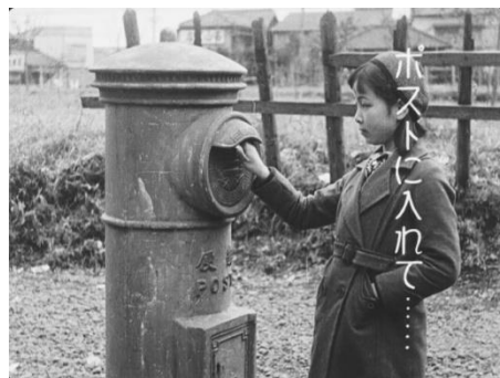
画像 2 『郵便物語 遞信シリーズ・第一編』 動画：0:27~0:56