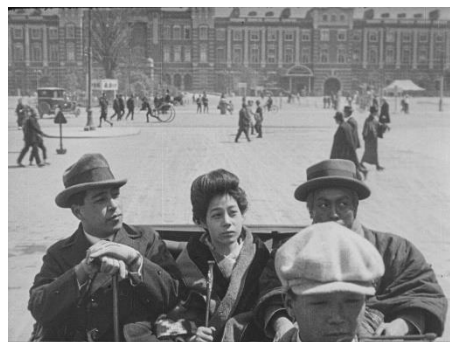
画像 2 『公衆作法 東京見物』 動画：0:31~1:11