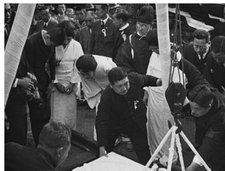
画像 4 『後藤伯爵葬儀』 動画：1:50~2:18