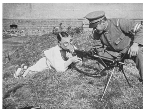
画像 6 『大日本国防婦人會 映画報 昭和九年十二月』 動画：3:01~3:23

【送付先】 国立映画アーカイブ「フィルムは記録する」広報担当 電話：03-3561-0823/FAX：03-3561-0830 E-mail：fiad@nfaj.go.jp