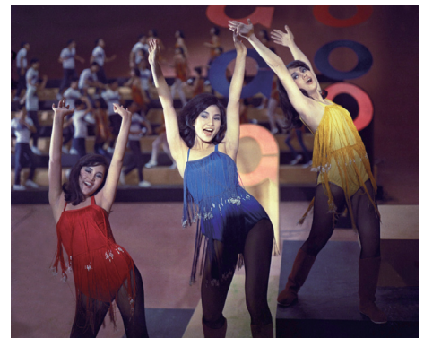
香港ノクターン