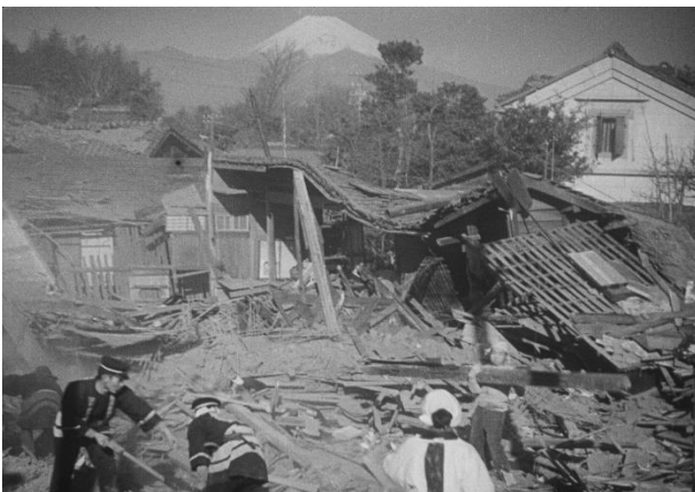
『北伊豆震災』 倒壊した家屋の背後に、冠雪した富士山が映る

飛行船からの航空撮影によって、急速に復興が進む東京の姿を収めた記録。霞ヶ浦海軍航空隊本部を離陸した飛行船は、常磐線上空を辿りながら、上野を皮切りに本郷、神田、九段、新宿、東京駅、神田、両国、浅草を周遊して帰還している。