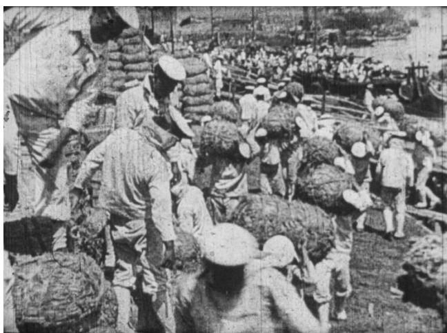
『震災後之日本』 海岸に届いた救援物資の移送風景

主に家庭用として販売されていた9.5mmフィルム（パテベビー版）による震災の記録。前半は東京、後半は横浜の震災前と被災状況の描写で構成されている。特に横浜のパートは、停泊中の船に担架で運ばれる被災者など、特筆すべき場面が多い。