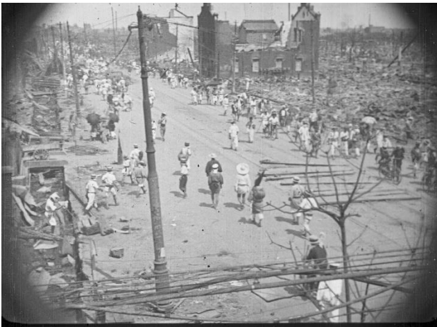
『第四報 東京大震災惨状』 両国駅の高架から見た本所周辺の惨状

大阪毎日新聞一面のアップから始まり、東京の各所（東京駅、上野駅、神田橋、万世橋、警視庁、帝国劇場、銀座、京橋、上野公園、上野広小路、日暮里駅）の状況が綴られていく。