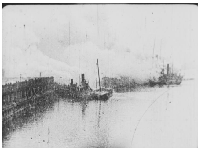
『日本之大地震』 炎上する横浜港に停泊中の船舶

今村明恒博士指導のもと、1930年11月26日に発生した北伊豆地震を事例に、地塊の分布や地震発生のメカニズム、地層の変化や建物被害のパターンを紹介するとともに、木造建築の耐震建築について、詳しい解説を施している。