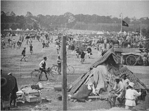
『東京大震災の惨状』 宮城前広場に立つ避難生活用のテント