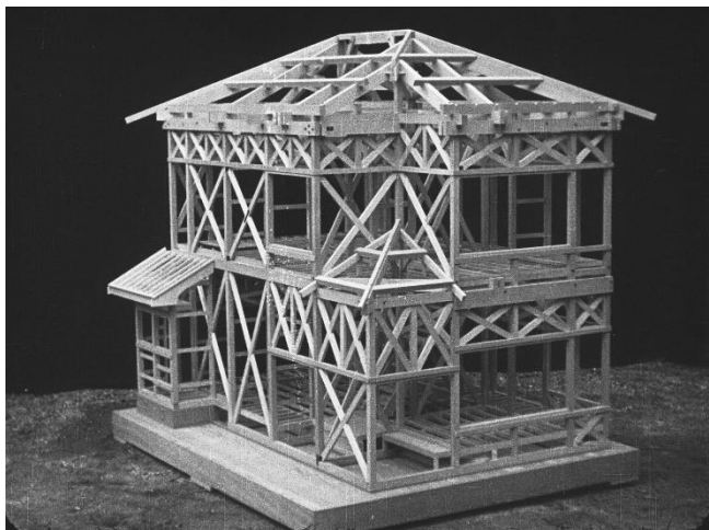
『地震と震災』 耐震技術を施した木造建築の模型