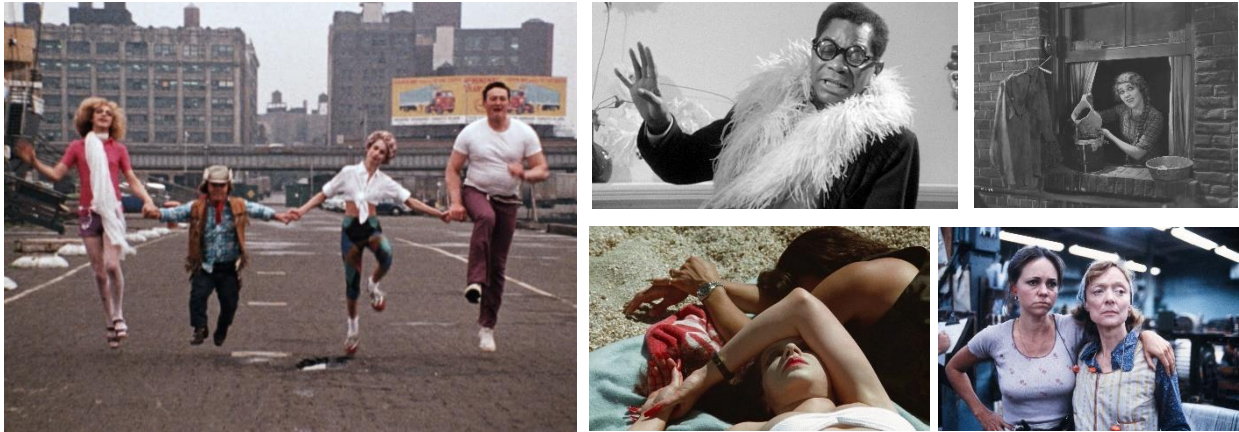
(左から時計周り)『きゅうり畑のかかし』/『ジェインの肖像』/『アンニー可愛いや』/『ノーマ・レイ』/『クイン・オブ・ダイヤモンド』