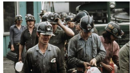
(左から)『恋の手ほどき』© 1958 WBEI/『バリー・リンドン』© 1975 WBEI/『アメリカ合衆国ハーラン郡』© Courtesy of Cabin Creek Films

《本特集に関するお問い合わせ》※一部の作品のステル写真を広報用に貸出します。ご希望の方は下記までお問い合わせください。