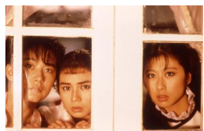
© 2010 Fortune Star Media Limited. All Rights Reserved. 『北京オペラブルース』