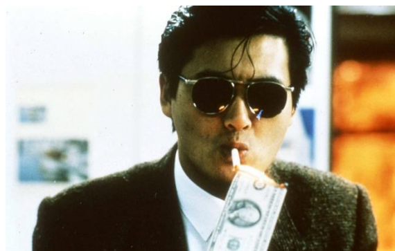
『男たちの挽歌』