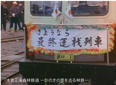
『木曾王滝森林鉄道 一ひのきの里を去る林鉄一』