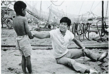
憎いあんちくしょう