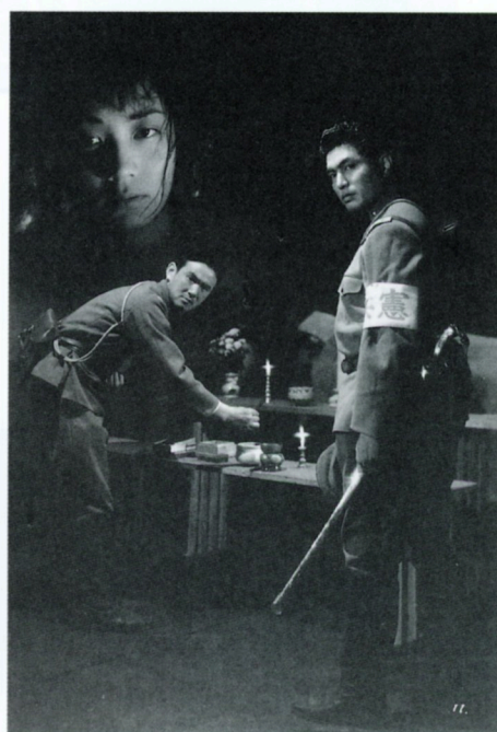
憲兵とバラバラ死美人

'68(東映京都)◎山下耕作◎後藤浩滋◎笠原和夫◎山岸長樹◎富田次郎◎津島利章◎鶴田浩二◎藤純子◎桜町弘子◎若山富三郎◎金子信雄◎曾我廼家明蝶◎名和宏◎曾根晴美◎佐々木孝丸◎三上真一郎◎沼田曜一◎香川良介