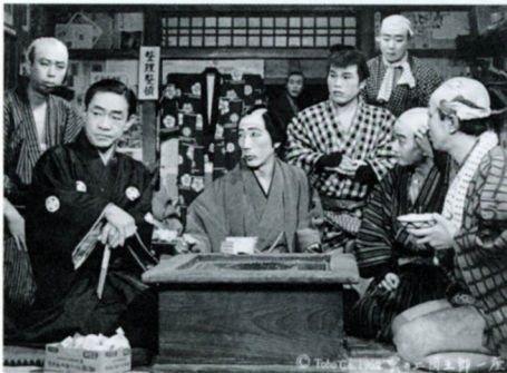
雲の上団五郎一座

'69(東宝)◎福田純◎佐藤勝◎三木のり平(平平平平)、菅原謙次(山辺)◎藤本義一◎逢沢譲◎育野重一◎小林桂樹、酒井和歌子、高橋紀子、田中邦衛、吉行和子、寺田農、平田昭彦、古今亭志ん朝、清水将夫、砂塚秀夫、稲野和子、草野大悟