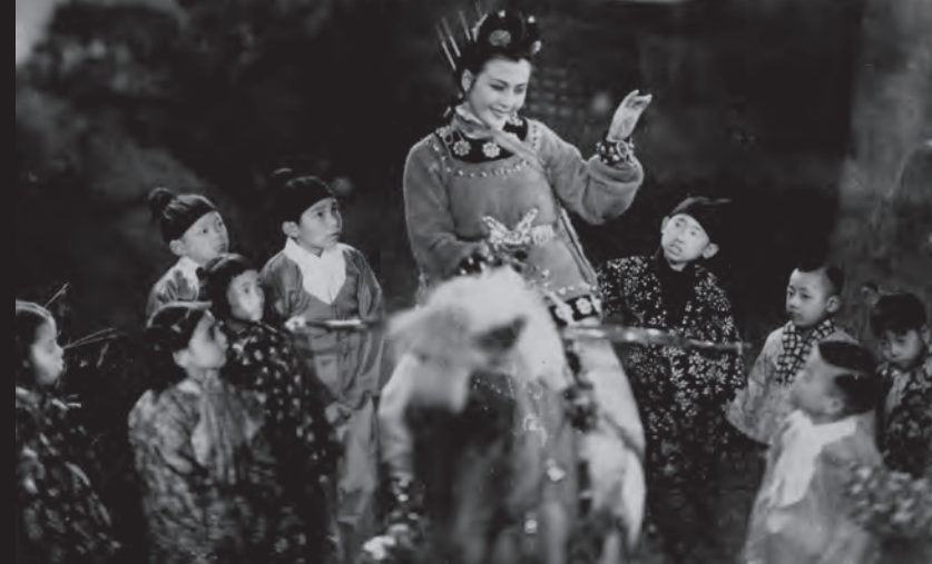
▲ 木蘭従軍 ▼ 祝福