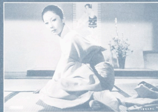
「こつまなんさん」(1960年)