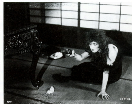
チート THE CHEAT (1915)