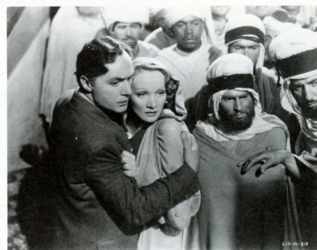
沙漠の花園 THE GARDEN OF ALLAH (1936)