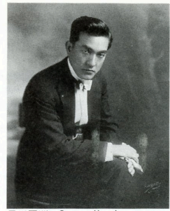
早川雪洲 Sessue Hayakawa