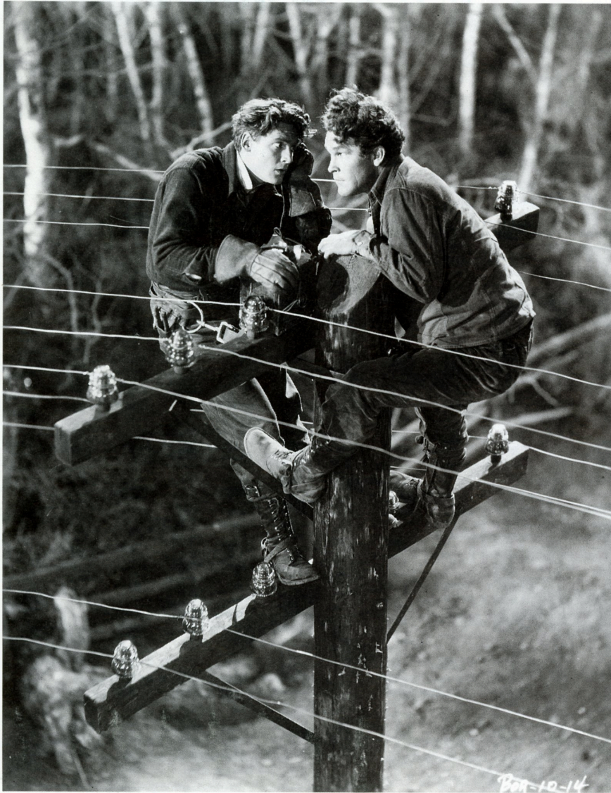
幸運の星 LUCKY STAR (1929)