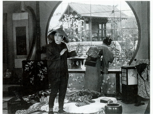
菊花一輪 A TOKIO SIREN (1920)

早川雪洲、青木鶴子、チャールズ・レイ、オズカー・ミシヨリ、 フランク・ボゼーギ、トッド・ブローウニング、トマス・H・インス…… ここにはあまたの知らぬアメリカ映画がある。