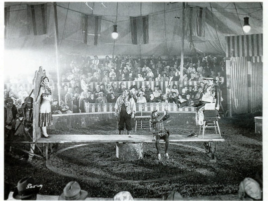
知られぬ人 THE UNKNOWN (1927)