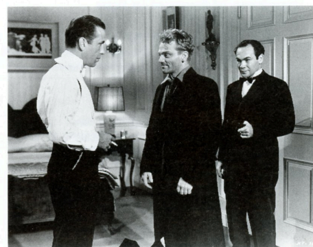
彼奴は顔役だ! THE ROARING TWENTIES (1939)