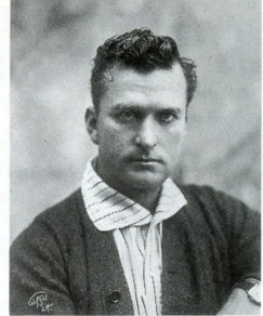
トマス・H・インス Thomas H. Ince

早川雪洲、青木鶴子、チャールズ・レイ、オズカー・ミシヨリ、 フランク・ボゼーギ、トッド・ブローウニング、トマス・H・インス…… ここにはあまたの知らぬアメリカ映画がある。