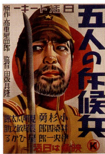
『五人の斥候兵』(1938年)ポスター