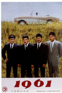
和田浩治・赤木圭一郎・小林旭・石原裕次郎 1961年日活カレンダーより