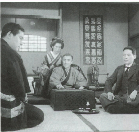
花と龍 第一部 洞海湾の乱斗

'51(東横映画)◎マキノ雅弘、萩原遼◎小国英雄◎民門敏雄、村松道平◎川崎新太郎◎小池一美◎大久保徳次郎◎片岡千恵蔵、喜多川千鶴、宮城千賀子、高田浩吉、浪路はるか、曉テル子、飯田蝶子、朝雲照代、美ち奴、逢初夢子、原健作