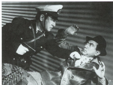
にっぽんGメン 第二話 難船崎の血闘