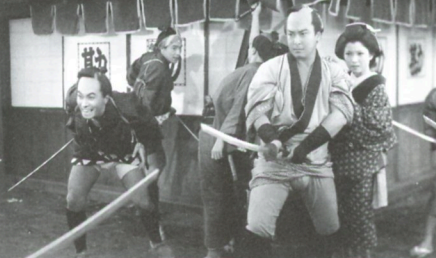
次郎長三国志 第五部 段込み甲州路

'55(日活)◎長谷川幸延◎マキノ雅弘◎高村倉太郎◎小池一美◎大久保徳次郎◎森繁久彌、山田五十鈴、水島道太郎、河津清三郎、左幸子、澤村國太郎、本郷秀雄、森健二、加藤智子(マキノ)◎智子、青木富夫