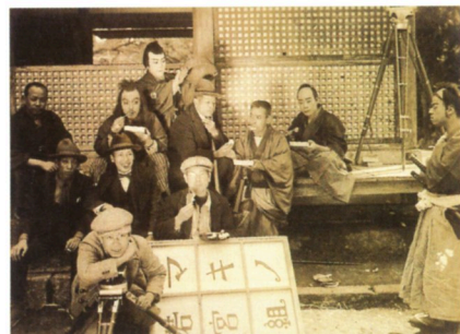
牧野省三(中央)とマキノ撮影隊スナップ

“日本映画の父”牧野省三(1878-1929)が率い、長男のマキノ雅弘(1908-93)を筆頭に多くのスター、スタッフを輩出した、日本映画文化の原点ともいえるマキノ映画(1921-31)。スチル、雑誌、遺品、映像などからマキノ映画の魅力と系譜を辿ります。