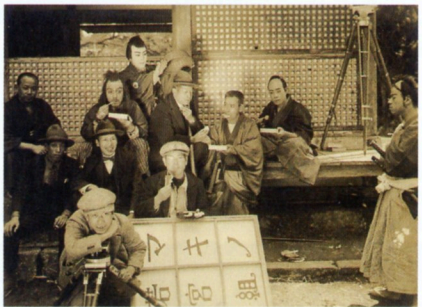
牧野省三(中央)とマキノ撮影隊スナップ

“日本映画の父”牧野省三(1878-1929)が率い、長男のマキノ雅弘(1908-93)を筆頭に多くのスター、スタッフを輩出した、日本映画文化の原点ともいえるマキノ映画(1921-31)。スチル、雑誌、遺品、映像などからマキノ映画の魅力と系譜を辿ります。