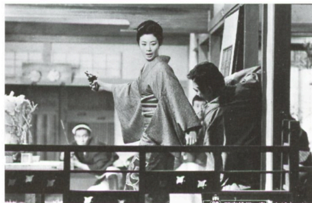
藤純子 引退記念映画 関東研修一家

'68(東映)◎棚田吾郎◎わし尾元也◎井川徳道◎木下忠司◎高倉健、藤山寛美、待田京介、松尾嘉代、渡辺文雄、菅原謙二、小島慶四郎、曾根晴美、遠藤辰雄、桑原幸子