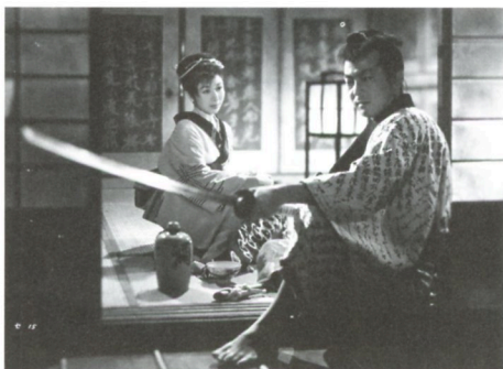
丹下左膳 乾雲の巻

'57(東映)◎山上伊太郎◎依田義賢◎伊藤大輔◎桂長四郎◎鈴木静一◎大友柳太朗、千原しのぶ、堀雄二、進藤英太郎、三島雅夫、杉狂児、徳大寺伸、松浦築枝、風見章子、三條雅也