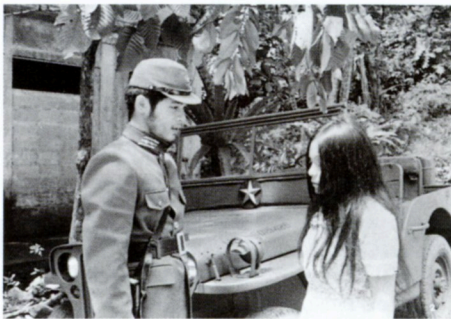
神のいない三年間

'89◎チー・ソウ・トン◎チ・ミン・ルー◎トランベット・ウィン・ウー◎チョー・ヘイン、キン・タン・ヌ、ウー・ウィン・スウェー、ドウ・ニン・デー [English Subtitled]