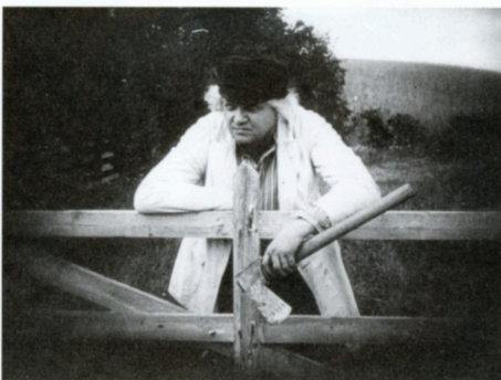
グロムダールの花嫁