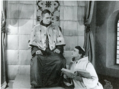
サタンの書の数ページ