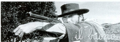
続・夕陽のガンマン(1966年)

I-1 1/8(火)6:30pm 1/12(土)1:00pm 1/18(金)6:30pm