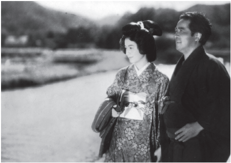
新しき土 [ドイツ版]