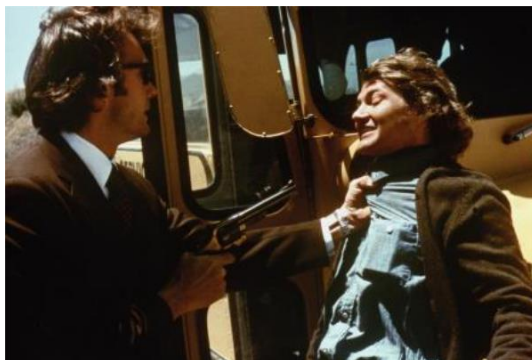
『ダーティハリー』

フィルムでイーストウツド作品をご覧になれる貴重な機会です。この上映を多くの方にご覧いただけますよう、今後の周知へのご協力をお願いいたします。