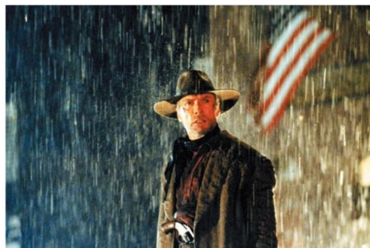
『許されざる者』© 1992 Warner Bros. Entertainment, Inc. All Rights Reserved.