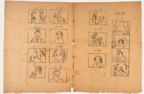
野上照代による画コンテ