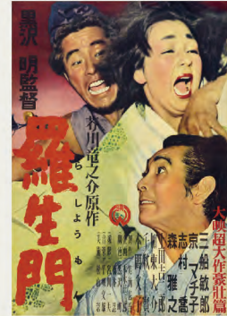
劇場公開オリジナル版ポスター © KADOKAWA 1950