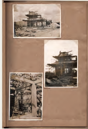
松山崇旧蔵『羅生門』写真アルバム