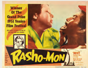
アメリカ オリジナル版VHSカバー