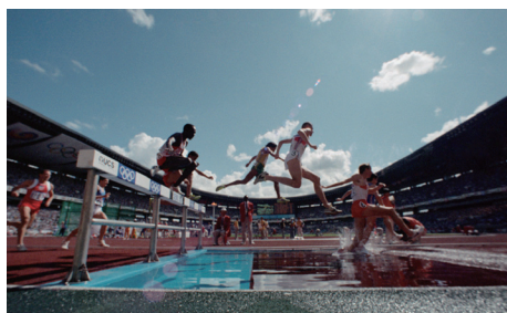
ハンド・イン・ハンド