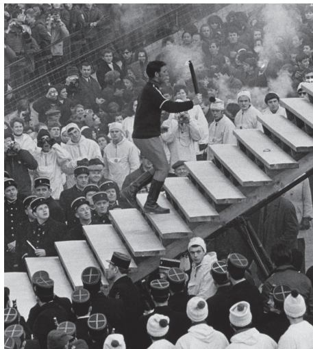
白い恋人たち/グルノーブルの13日