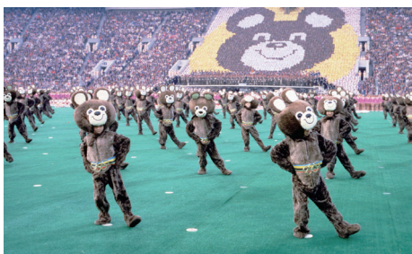
スポーツよ、君は平和だ!

1999(キャッピャー・プロダクションズ) 監修/バド・グリーンズバン 監修/ブルース・ベッファ 監修/金谷宏二、デイヴィッド・ゲールディング、ハーブ・コソヴァー、ビル・ミルズ、リック・ロバートソン 監修/リー・ホルドリッジ 監修/ウィル・ライマン