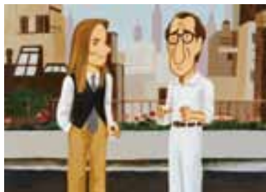
『アニー・ホール』(「CINEMA CALENDAR 2005」より)

NFAJ Digital Gallery NFAJデジタル展示室 Digital Gallery 下記ホームページからお入りください https://www.nfaj.go.jp/online-service/digital-gallery