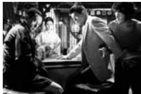
新宿アウトロー ぶっ飛ばせ