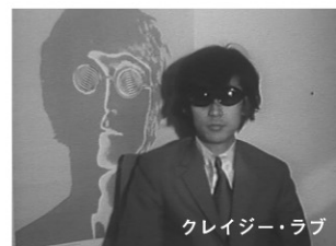
クレイジー・ラブ