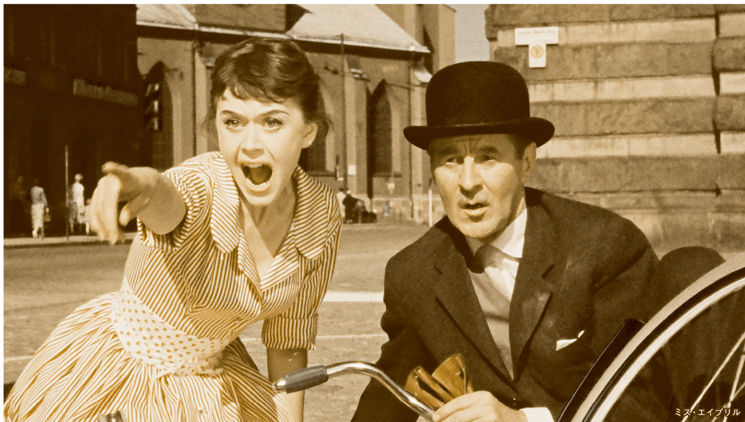
ミス・エイブリル