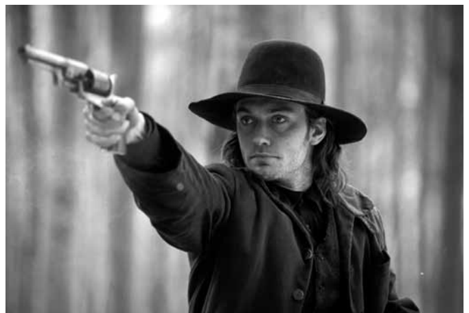
コールドマウンテン