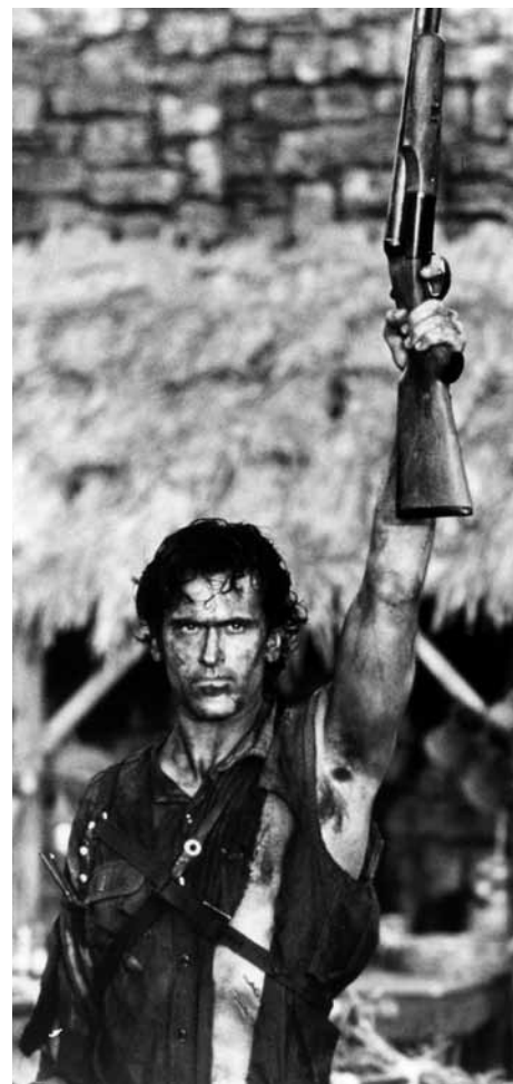
キャプテン・スーパーマーケット