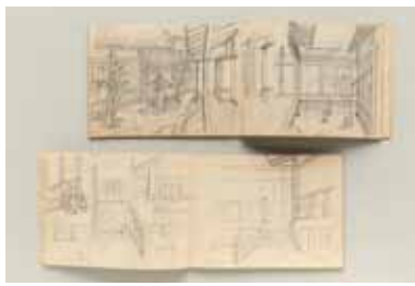
『春琴物語』(1954年、伊藤大輔監督)スケッチ帖