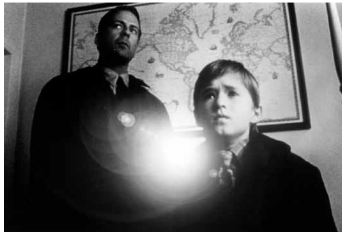
シックス・センス