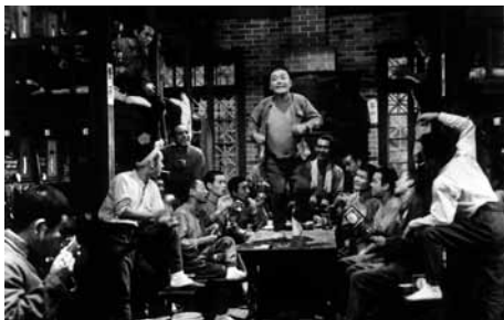
人間の条件 第三部・第四部

1961(にんじんくらぶ)◎小林正樹◎五味川純平◎松山善三、稲垣公一◎宮島義勇◎平高主計◎木下忠司◎仲代達矢、新珠三千代、中村玉緒、高峰秀子、川津祐介、笠智衆、内藤武敏、岸田今日子、腫麗子、諸角啓二郎、清村耕次、金子信雄