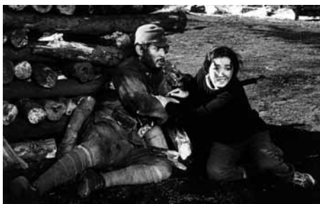
人間の条件 第五部・第六部