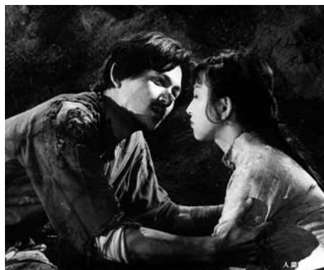
人間の條件 第一部・第二部