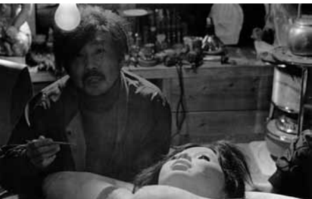
「エロ事師たち」より 人類学入門

1985(ディレクターズ・カンパニー)◎相米慎二◎加藤祐司◎伊藤昭裕◎池谷仙克◎三枝成章◎三上祐一、紅林茂、松永敏行、工藤夕貴、大西結花、会沢朋子、三浦友和、尾美としのり、鶴見辰吾、寺田農、小林かおり、石井富子、佐藤允、伊達三郎