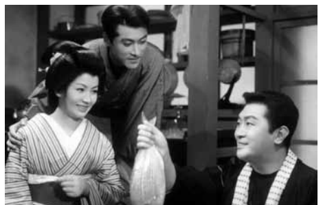
婦系図より 湯島に散る花