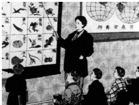
日本歴史教材映画大系 一明治のはじめ 文明開化