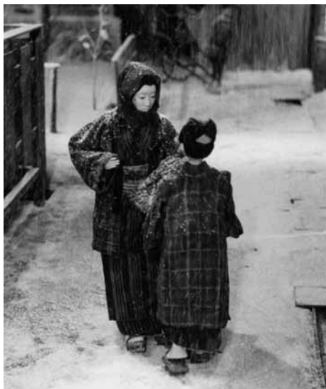
糸あやつり 人形劇映画 明治はるあき

1975(鐵プロダクション=ATG)◎村野鐵太郎◎藤本義一◎杉浦久◎吉岡康弘◎上野堯◎林光◎桂福團治◎片桐夕子◎露の五郎◎中原早苗◎井川比佐志◎信欣三◎本郷淳◎伊達三郎◎早川雄三◎蛭雪太郎◎江藤潤◎渡辺潔◎石山雄大◎福原圭一◎入江洋佑