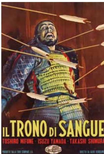
『蜘蛛巣城』イタリア版[2シート判](1959年) ポスター：カルラントニオ・ロンジ

5月・6月の常設展ギャラリートーク 毎月第一土曜日12時より(休室の場合は第二土曜日) 5月12日、6月2日