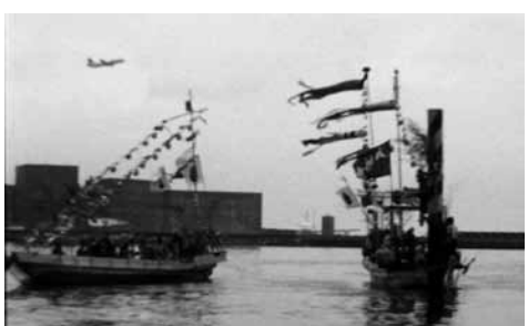
大田区につたわる無形文化財