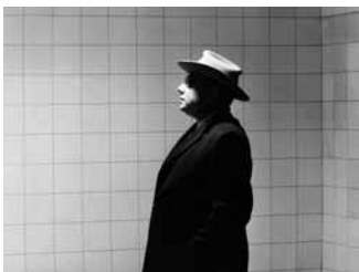
ジャン=ピエール・メルヴィル、『リスボン特急』の頃