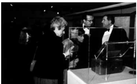
日米文化交流の記録 —1983年—

1981 企画：映画「早池峰神楽の里」をつくる会 | 製作：岩波映画 (◎) 羽田澄子 (◎) 工藤充 (◎) 西尾清、瀬川順一、若林洋光、西山東男、田代啓史、内藤雅行、下平正巳、千葉寛 (◎) 久保田幸雄 (◎) 秋山邦晴 (◎) 川久保潔