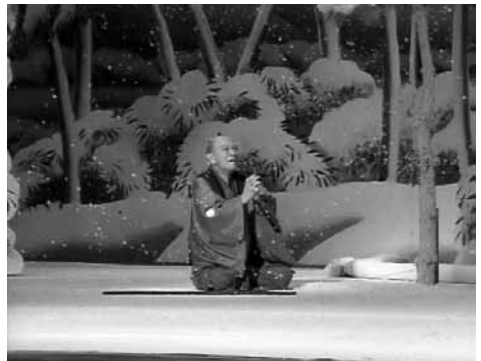
歌舞伎役者 片岡仁左衛門 孫右衛門の巻