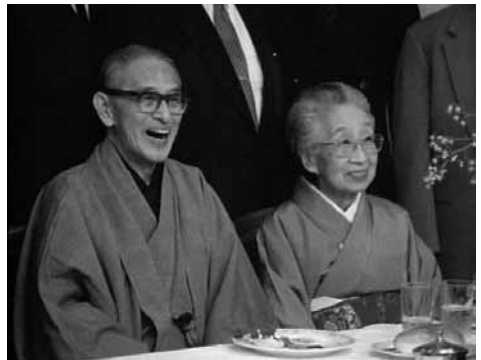
歌舞伎役者 片岡仁左衛門 登仙の巻