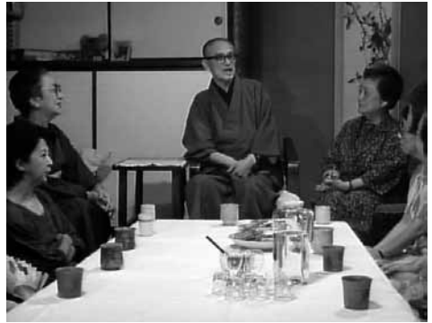
歌舞伎役者 片岡仁左衛門 人と芸の巻 下巻