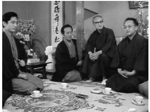
歌舞伎役者 片岡仁左衛門 孫右衛門の巻