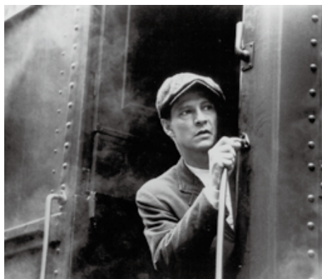
メイトワン1920 image courtesy of Park Circus/MGM

35mm preservation print courtesy of the UCLA Film & Television Archive.