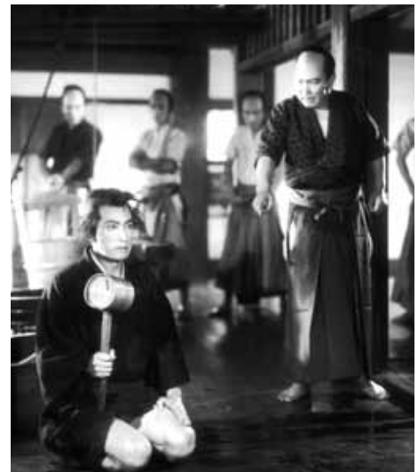
剣難女難 第一部 女心流転の巻

1957(東映京都)◎加藤泰◎山手樹一郎◎結束信二◎三木滋人◎塚本隆治◎高橋半◎大友柳太朗◎長谷川裕見子◎波島進◎花柳小菊◎原健策◎浦里はるみ◎薄田研二◎吉田義夫◎円山栄子◎山口勇◎岸井明◎中野雅晴