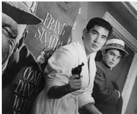
『花と嵐とギャング』高倉健(左)

1931年、福岡県中間市生まれ。1955年、ニューフェイス第2期生として東映に入社し、翌年に主役デビュー。1960年代に興隆した任侠映画で数々の主役を演じ、時代を象徴するスターとなる。1976年以降はフリーとなって晩年まで国内外で活躍を続け、2013年には俳優として4人目となる文化勲章を受章した。2014年11月10日逝去。