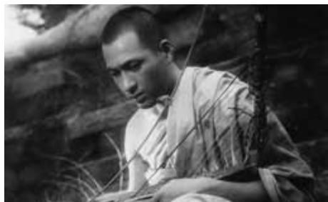
『ビルマの豎琴』 安井昌二