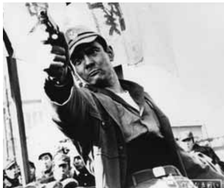
『仁義なき戦い』菅原文太

1933年、宮城県仙台市生まれ。ファッション・モデルとして活躍中にスカウトされて1959年に新東宝と専属契約。同社の倒産後、1961年に松竹に移り、さらに1967年に東映へ。「仁義なき戦い」シリーズでトップ・スターの座を確立。1970年代の日本映画の中心的存在ともなった。2014年11月28日逝去。