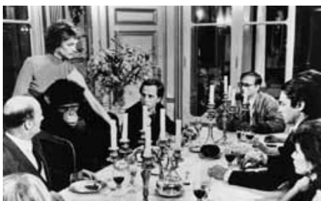
『マックス モン・アムール』

1987(日本テレビ放送網=東宝)◎小林達比古◎宮本久幸◎すまけい◎市川準◎内館牧子◎金田克美◎板倉文◎富田靖子◎大楠道代◎高嶋政宏◎藤代美奈子◎伊藤かずえ◎室井滋◎伊織祐未◎香苗圭子◎イッセー尾形◎丘みつ子