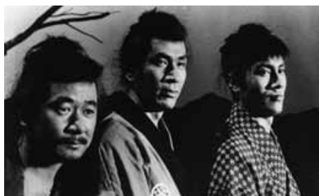
『三匹の侍』 長門勇(左)