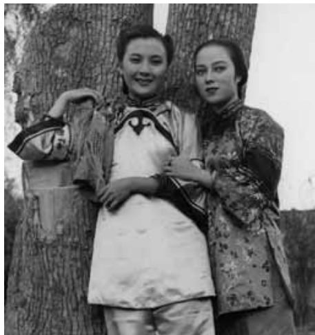
『萬世流芳』 山口淑子(李香蘭)(右)

1920年、当時の中華民国・奉天に生まれ、後に中国名「李香蘭」を得る。1938年、満洲映画協会(満映)に入社し、「中国人スター」として日中両国で人気となり、多くの国策映画に出演し、流行歌を歌った。戦後は本名の山口淑子に戻り日本映画を中心に活躍し、1958年に女優引退。2014年9月7日逝去。