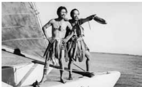
『ハワイ珍道中』 田端義夫(左)

1957(宝塚映画) ①淡路恵子(喜美子) ②稲垣浩 ③北條秀司 ④八住利雄 ⑤岡崎宏三 ⑥伊藤薫朔 ⑦植田寛 ⑧深井史郎 ⑨乙羽信子 ⑩田中絹代 ⑪扇千景 ⑫伊藤久哉 ⑬小沢栄太郎 ⑭浪花千栄子 ⑮田中春男 ⑯平田昭彦 ⑰東郷晴子 ⑱千石規子