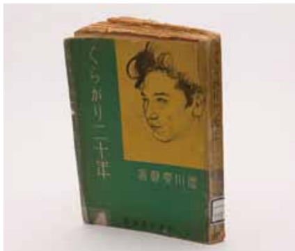
徳川夢声「くらがり二十年」(1934年)