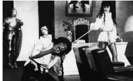
『コートローまかりとおる!』