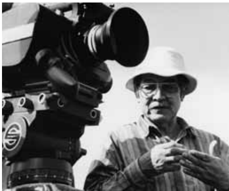
『親鸞 白い道』の三國連太郎監督

1923年、群馬県太田市生まれ。1950年松竹大船に研究生として入社。木下恵介監督の『善魔』の主演に抜擢されデビュー。その後東宝、日活、東映をへてフリーに。風格のある演技で多くの名匠に出演を請われ、生涯で180本以上の映画に出演した。2013年4月14日逝去。